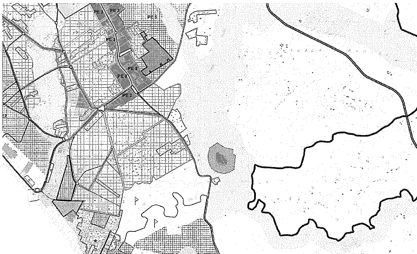
Stralcio tavola P.1.3